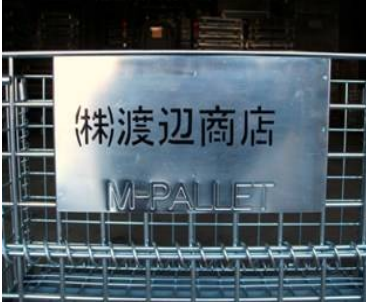
N(ネーム記入)・NN(ナンバリング)