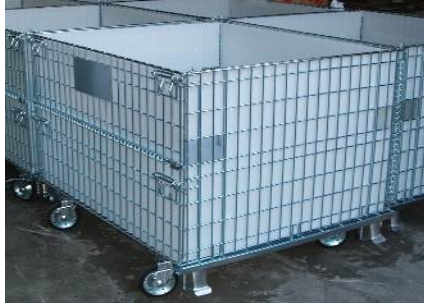
C(キャスター取付)・D(ダンフﾟラ取付)