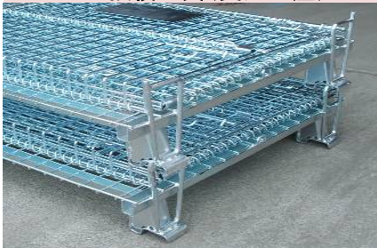
MPP段積金具(受注生産)